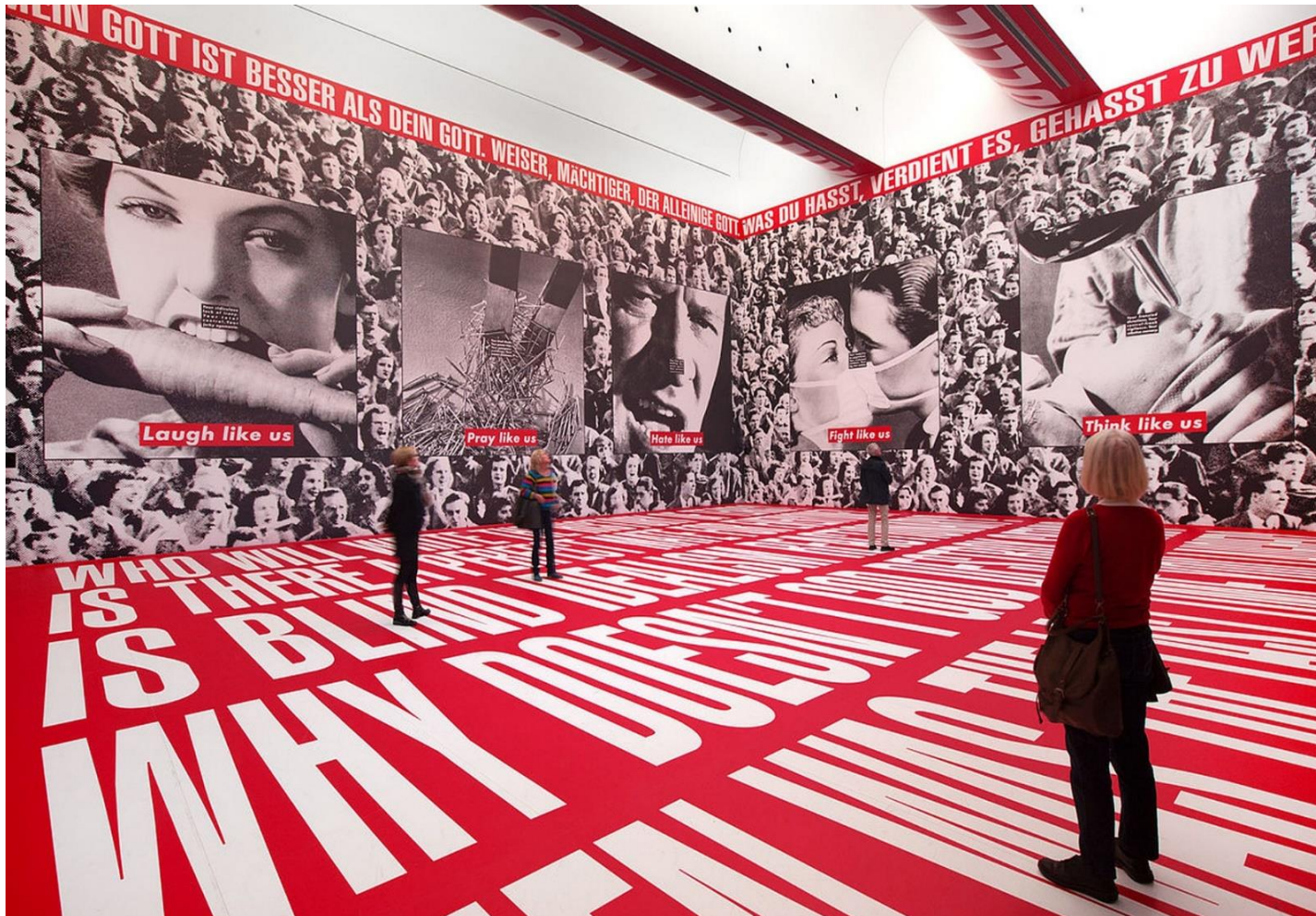
Barbara KRUGER, Untitled (Sans titre) , 1994-1995, dimensions variables, installation de sérigraphies photographiques sur papier. Museum Ludwig, collection Ludwig, Cologne, Allemagne.