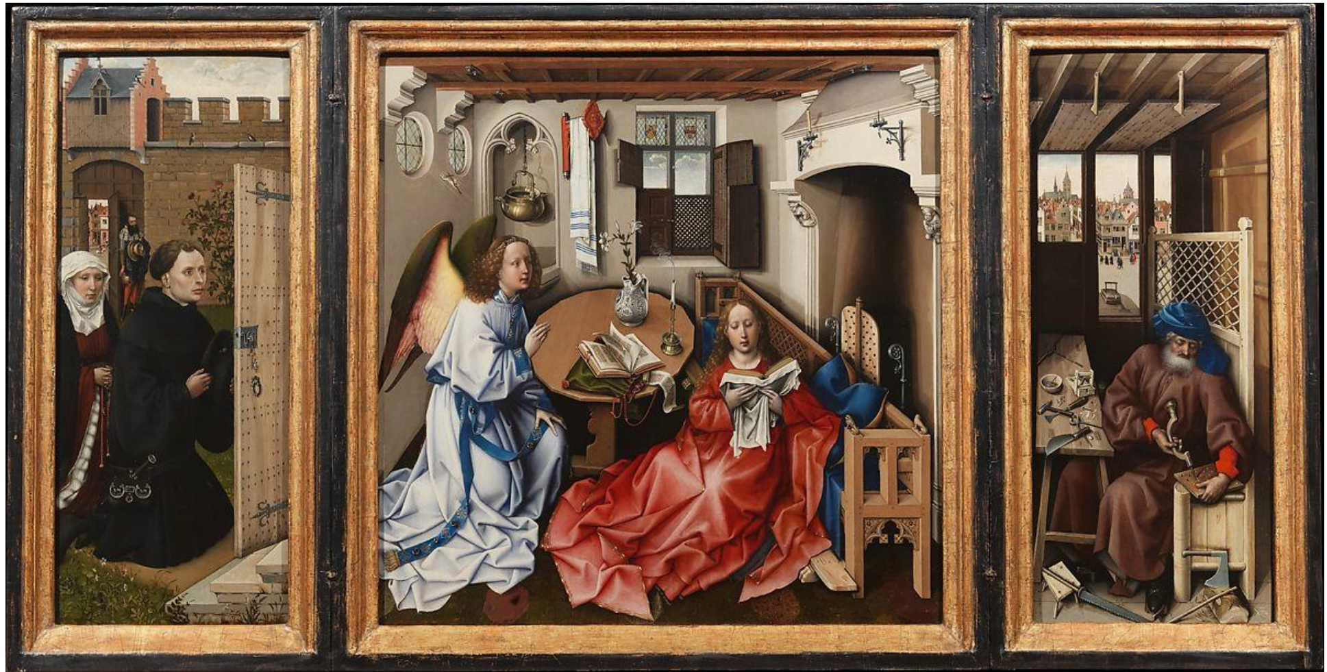
Robert CAMPIN, Triptyque de l'Annonciation (autel de Mérode), 1427-1432, huile sur panneau de chêne, 64,1 x 63,2 cm (panneau central), 64,5 x 27,3 cm (chaque panneau latéral). The Metropolitan Museum of Art, New York, États-Unis.