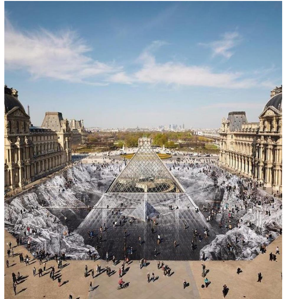
JR, Le secret de la Grande Pyramide , installation participative du 26 au 31 mars 2019, collage photographique, 17 000 m 2 dans la Cour Napoléon, auquel 400 volontaires ont contribué. Pyramide du Louvre, Paris, France.