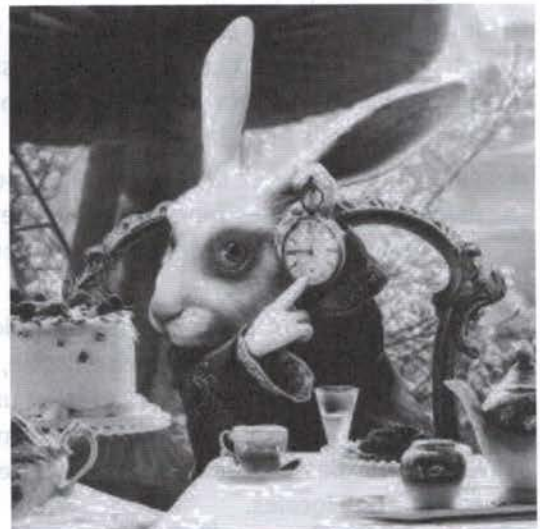
Lewis Carroll, Le lapin d'Alice au pays des merveilles (1869), Disney, 2010.