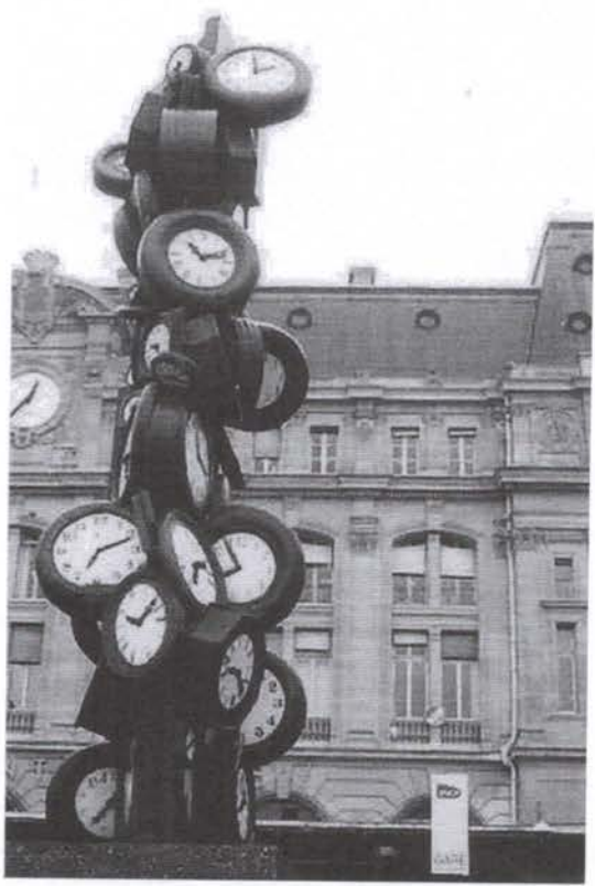
Lefèvre Daniel, L'horloge de la gare Saint-Lazare , 2011.