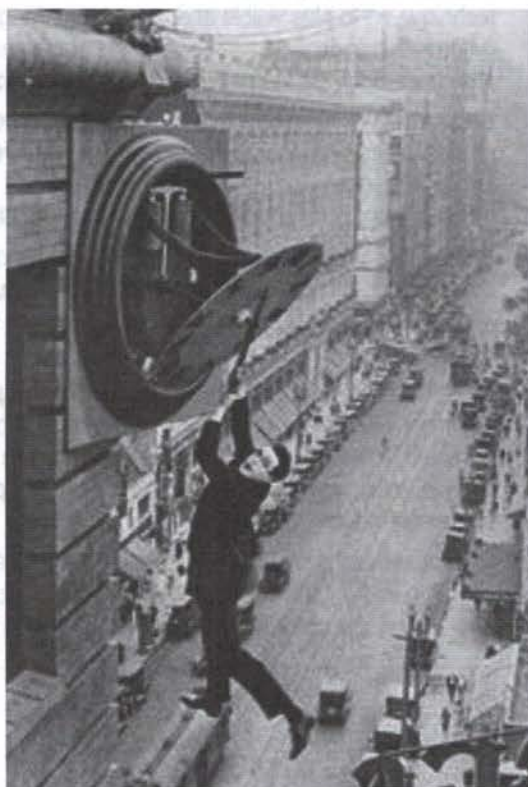
Harold Lloyd, Safety last , 1923.